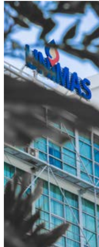
Cetakan Julai, 2021