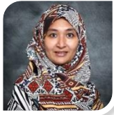
Penyelaras Perancangan Strategik Strategic Planning Coordinator