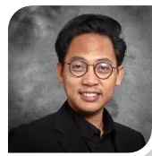
Timbalan Dekan (Hal Ehwal Pelajar dan Alumni) Deputy Dean (Student Affairs and Alumni)