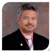
PENOLONG NAIB CANSELOR Assistant Vice-Chancellor