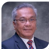
Naib Canselor Vice-Chancellor