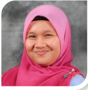
Penolong Pendaftar Kanan Senior Assistant Registrar