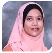
Zaharaa' binti Hadzi Penolong Juruukur Bahan