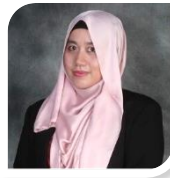
Timbalan Dekan Prasiswazah Deputy Dean (Undergraduate)