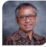
Penyelaras Program Pascasiswazah Postgraduate Programme Coordinator