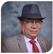
Timbalan Dekan Penyelidikan & Pengkomersialan Deputy Dean (Research & Commercialization)