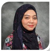
Ketua Jabatan Senibina Head of Department (Architecture)