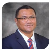
TIMBALAN NAIB CANSELOR (PENYELIDIKAN DAN INOVASI) Deputy Vice-Chancellor (Research & Innovation)