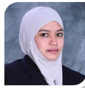
Ketua Jabatan Ukur Bahan Head of Department (Quantity Surveying)