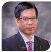
TIMBALAN NAIB CANSELOR (AKADEMIK DAN ANTARABANGSA) Deputy Vice-Chancellor (Academic & International)